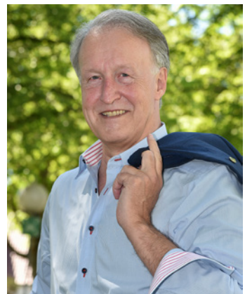
Roland Klenk Oberbürgermeister der Großen Kreisstadt Leinfelden-Echterdingen