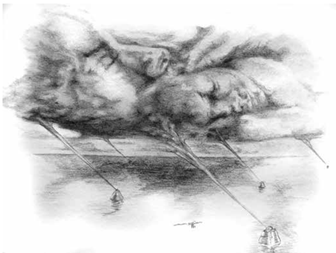
MATHIAS BÖHM | *Wolkenbojen*, Bleistift auf Aquarellkarton

Surrealisten, wie der Künstler Mathias Böhm, streben danach, träumerische Elemente in Bildern auszudrücken. In dieser Darstellung einer liebevollen Haltung, die es für immer oder zumindest für längere Zeit festzuhalten gilt, zeigt der Künstler sein großes, zeichnerisches Können. Seine Handschrift ist deutlich vom Surrealismus beeinflusst, aber in eine modernere Form transformiert. Die Arbeiten des Künstlers beinhalten, wie im Surrealismus üblich, die Auseinandersetzung mit aktuellen Themen der heutigen Zeit und ihre Auswirkungen und Zwänge auf das Individuum – auch eine Selbstreflexion. Seit 2016 adaptiert Mathias Böhm auch am Computer generierte, Traumbilder aus Vektorgrafiken, Fotografien und Farbverläufen in gespachtelte Ölbilder. Er schafft auf diesem Wege andere Visionen und meint damit seinen eigenen, abstrahierten Surrealismus.