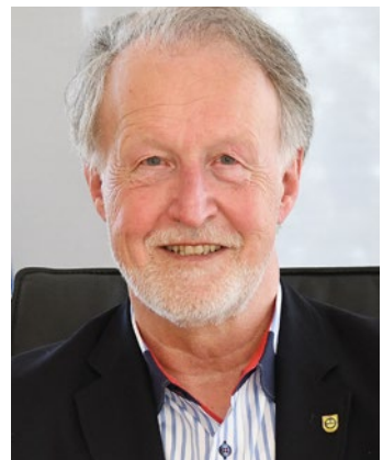
Roland Klenk Oberbürgermeister der Großen Kreisstadt Leinfelden-Echterdingen

Auch im Namen meines Kollegen aus Filderstadt, Herrn Oberbürgermeister Christoph Traub, wünsche ich Euch eine interessante Zeit auf der „Börse deiner Zukunft“ 2021 und viel Erfolg dabei, Euren eigenen beruflichen Weg zu finden. Herzliche Grüße