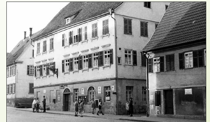
Gasthof „zum Hirsch“ in den 1930er Jahren