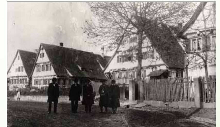
Echterdinger Bauern in Tracht vor den „Maierhöfen“ in der Maiergasse. 1920er Jahre

Wenn Sie also während des Krautfestes nicht dazu kommen, wiederholen Sie den Besuch in Echterdingen und begeben sich auf eine kleine Zeitreise durch den historischen Ortskern. Es lohnt sich!