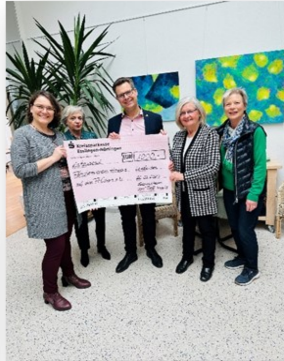
Spendenübergaben aus diversen ehrenamtlichen Gruppen an versch. Vereine