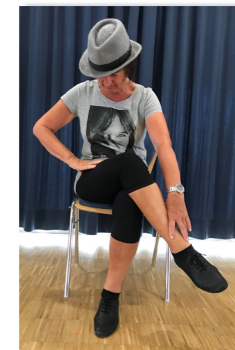
Tango mit und am Stuhl macht Bewegung, Musik und Gefühl des Tango Argentino für alle erlebbar.