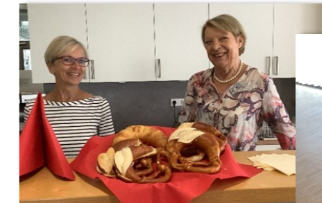
Bei Kontaktcafé, Suppenküche und Montagsfrühstück