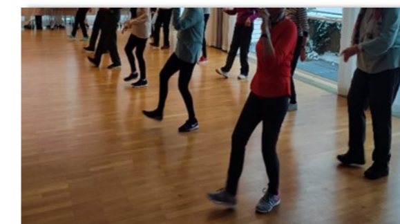
Yoga-, Tanz- und Bewegungsangebote zu günstigen Preisen