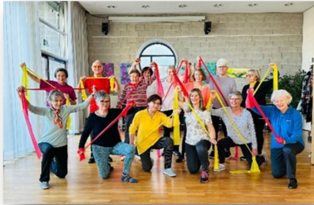
Diverse Tanz- und Bewegungsangebote zu sehr günstigen Preisen.