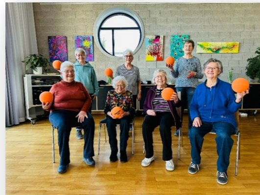
Angepasste sportliche Aktivität zur Erhaltung der körperlichen Beweglichkeit.