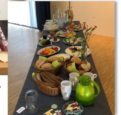
finden alle ein Plätzchen und Anschluss.