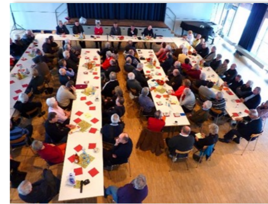
Der Pressestammtisch - Monat für Monat interessante Themen und Diskussionen