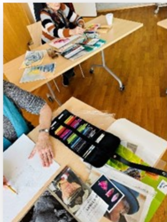
Malen als Bsp. für die Förderung von Kreativität, Kommunikation und Feinmotorik in unseren Gruppen