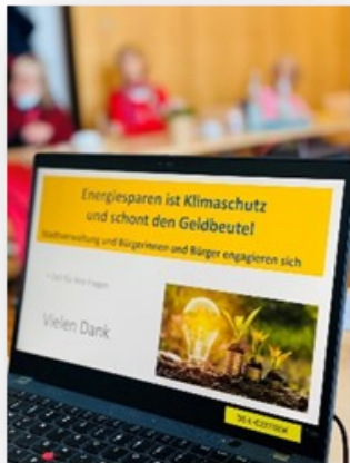
Informationsveranstaltungen zu aktuellen Themen mit den Servicegruppen