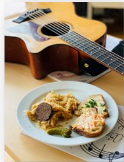
Musik & Essen hält Leib und Seele zusammen