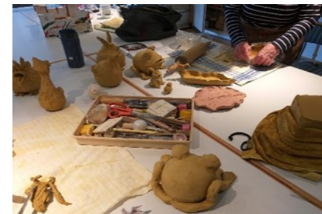
Tonen als Beispiel für die Förderung von Kreativität, Kommunikation und Feinmotorik in unseren Gruppen. Und Spaß macht es außerdem!