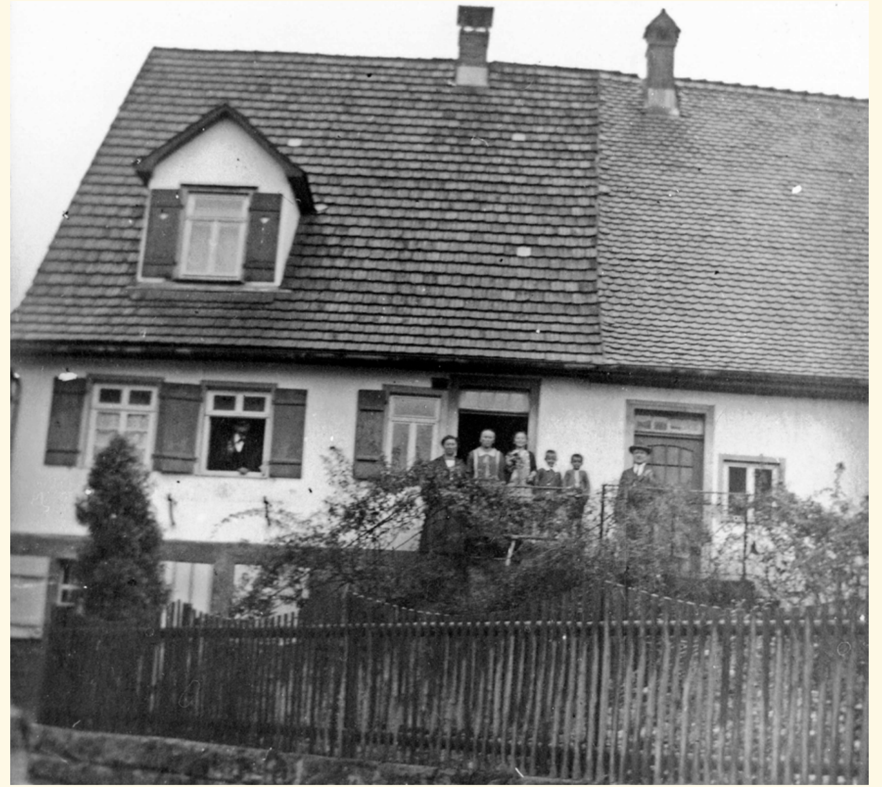
Haus Burkhard (Thumm)/Metzger in der Rosenbrunnenstraße, um 1925

Weitere Informationen der einzelnen Stationen finden Sie online – hierzu einfach den entsprechenden QR-Code scannen.