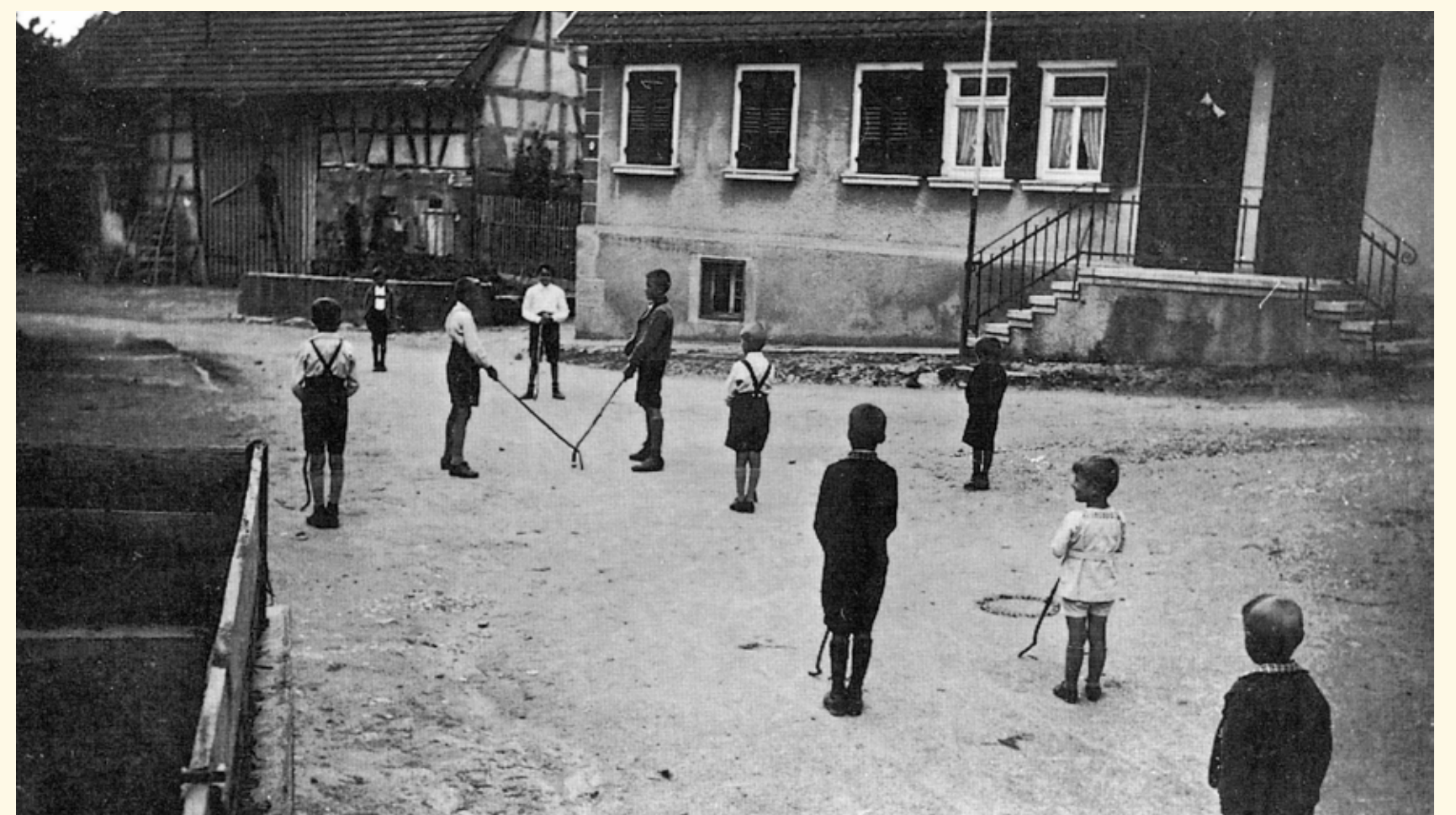
Haus Rath/Reimold in der Rosenbrunnenstraße, »in de Höf«, 1930er Jahre