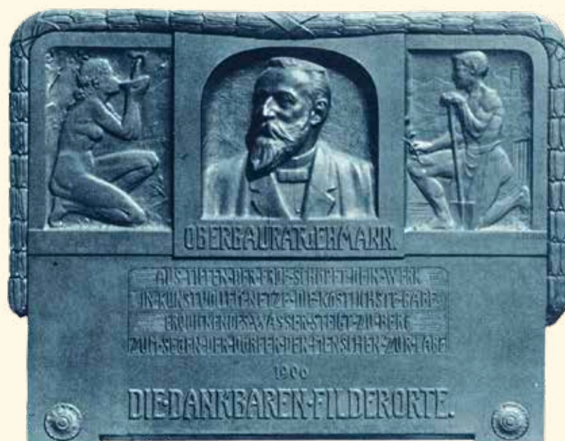
Gedenktafel für Hermann v. Ehmman, Planer und Erbauer des Wasserwerks

Weitere Informationen der einzelnen Stationen finden Sie online – hierzu einfach den entsprechenden QR-Code scannen.