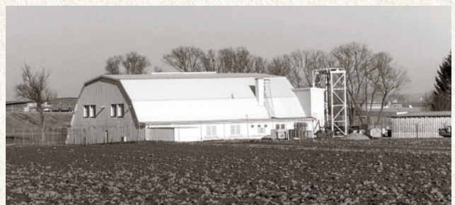
Der Hangar, der als Unterkunft für die jüdischen Häftlinge diente, steht heute noch auf dem Areal der US-Airbase.